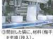
③開封した袋に、材料(梅干)を充填(投入)。