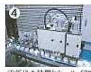
④折込み装置とシール・印字装置