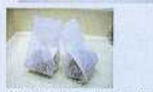
ゼリーや羊羹のアルミ袋、プラスチックフィルム袋にも対応。