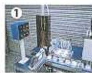
①ガセット袋を1枚ずつ引き出して、開封・成型。